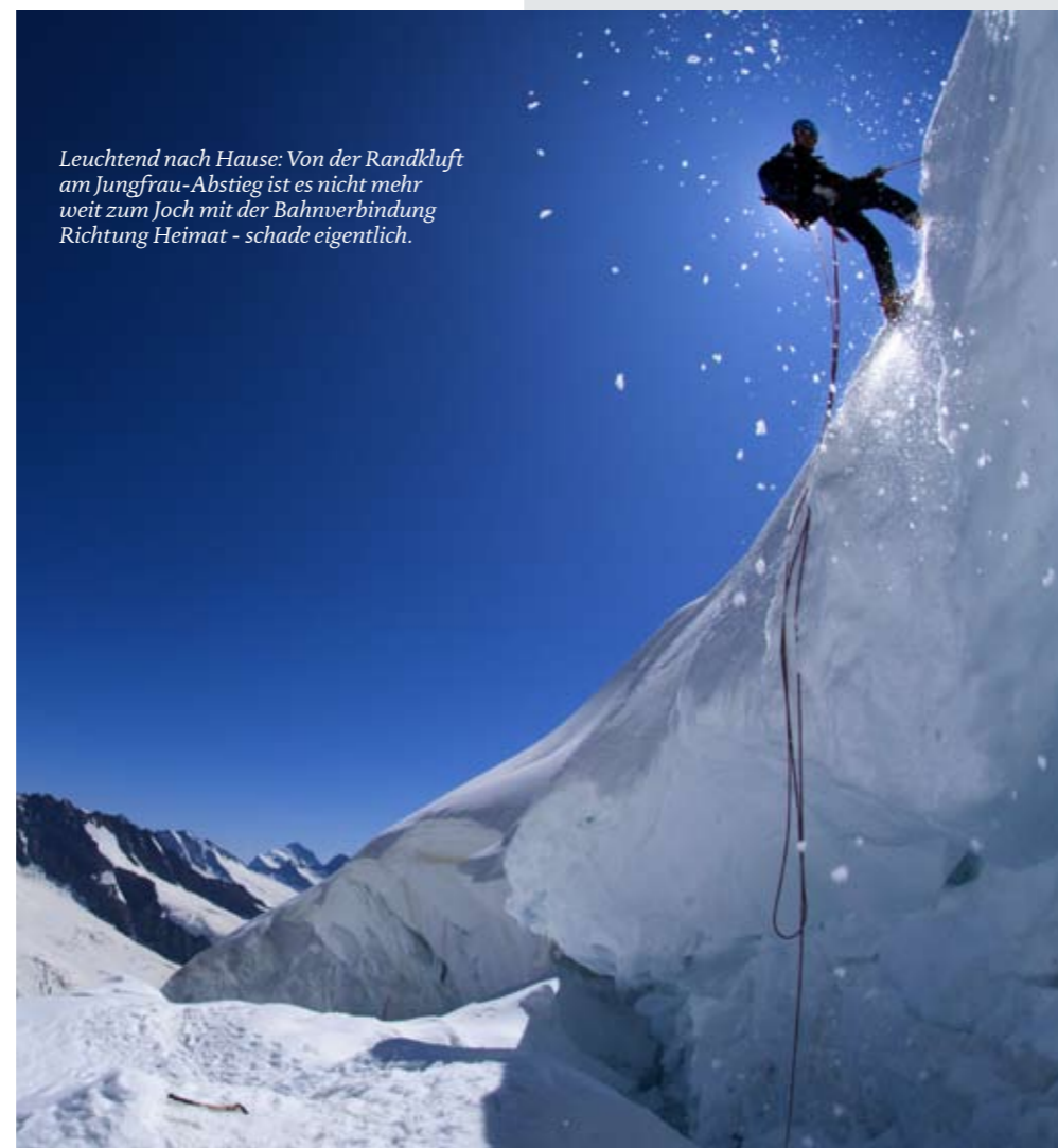
Leuchtend nach Hause: Von der Randklüfte am Jungfrau-Abstieg ist es nicht mehr weit zum Joch mit der Bahnverbindung Richtung Heimat - schade eigentlich.

Mönchsjochehütte. Die liegt nur eine Stunde vom Jungfraujoche entfernt, was sich in der Atmosphäre bemerkbar macht, die etwas an eine Bahnhofskantine erinnert. Auch der Ruf des Mönchs als relativ einfacher Viertausender trägt zum Massentourismus bei. Um dem zu erwartenden Stau auf dem Normalweg zum Mönch zu entgehen, haben wir uns für seinen Südwestgrat entschieden. Ein Volltreffer für einen entspannten Bergtag! Nach einem gemütlichen Frühstück um sieben Uhr turnen wir allein und genüsslich über festen Fels zum Gipfel. Erst dort treffen wir wieder auf die Reisegruppen vom Normalweg. Wir steigen den selben Weg wieder ab, den wir gekommen sind; spektakulär ausgesetzt, aber an keiner Stelle schwierig zu klettern.