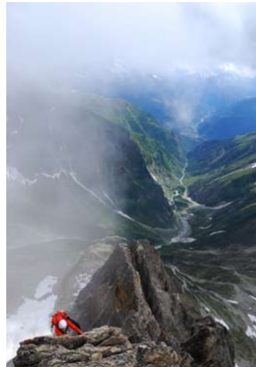
Über den Dingen: Zweitausend Meter unter dem Blüemlisalp-Abstieg liegt der Öschinensee, unter dem Stockhorn-Südgrat zieht das Baltschiederetal Richtung Rhone (links). An der schmuckeligen Osteggghütte ist man unter sich; die Kletterei über das Ostegg zum Eiger stellt gehobene Ansprüche im Fels.

schroffen Talschluss. Hier herauf kommen nur Bergsteiger – und auch nur solche, die darunter nicht gemessenes Schreiten im Schnee verstehen, sondern die klettern wollen. Der prominenteste Berg der Gegend, das Bietschhorn, ist zwar kein Viertausender, hat aber einen Ruf als schwerer Gipfel, der ihn für Kletterer attraktiv macht. Sein Normalweg kommt vom Lötschentäl über den Westgrat und verschafft der Baltschiederklause keinen Verkehr; nur