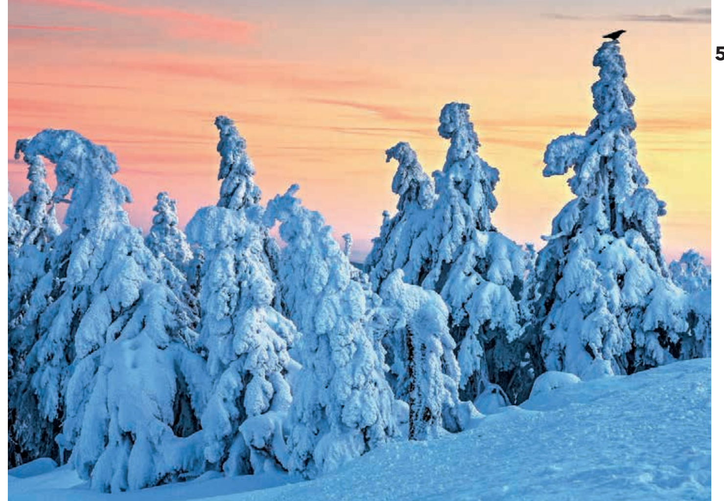
Klar, dass sich bei einer Tour auf dem Harzer Hexenstieg Abraxas auf ein Foto schleicht!

Plötzlich durchbricht ein lautes Schnaufen und Rattern die frostige Ruhe. Ein dampfendes Ungetüm rollt direkt auf uns zu: die Brockenbahn, deren hübsche alte Dampflok eine große, orange angeleuchtete Wolke zurücklässt, die sich in den vereisten Spitzen des Waldes langsam auflöst. Die ursprünglich auch für den Güterverkehr verwendete Eisenbahnstrecke wird heute hauptsächlich touristisch genutzt und führt von Drei Annen Hohne hinauf auf den Brocken. Wir wandern gemütlich weiter zum Gipfel und können uns an den Lichtreflexionen im Schnee und den mit weißem Zuckerguss überzogenen Bäumen nicht sattsehen. Mit über 1000 Meter Seehöhe befindet sich die Gipfelkuppe des Brockens oberhalb der Waldgrenze. Darunter hat sich im zähen Ringen mit Wind und Kälte ein Krüppelwald gebildet, der eher an die sibirische Taiga erinnert als an ein deutsches Mittelgebirge.