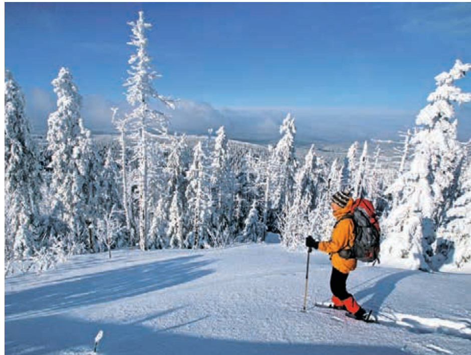
Schneeschuhe erlauben Abstecher in den unberührten Tiefschnee. Der Harzer Hexenstiege ist aber auch im tiefsten Winter mit normalen Wanderschuhen machbar.

Doch hier, kurz vorm Ziel, im »Grand Canyon« des Harzes, wie manche Lokalpatrioten die Gegend in enthusiastischer Übertreibung nennen, zieht die Natur noch einmal alle Register, um den mittlerweile müden Wanderer zu beeindrucken: senkrechte Felswände, seltsam gekrümmte Wurzeln, der gurgelnde und überschäumende Fluss, und immer wieder gigantische Eiszapfen, die bedrohlich über dem Weg hängen. Diese Märchenlandschaft lässt uns erneut an jeder Wegbiegung unsere schlappen Beine vergessen. Doch diese