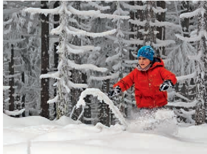
Eingeschneite Wälder wecken Kindheitserinnerungen bei den Eltern und sorgen für winterliche Hochgefühle beim Nachwuchs.