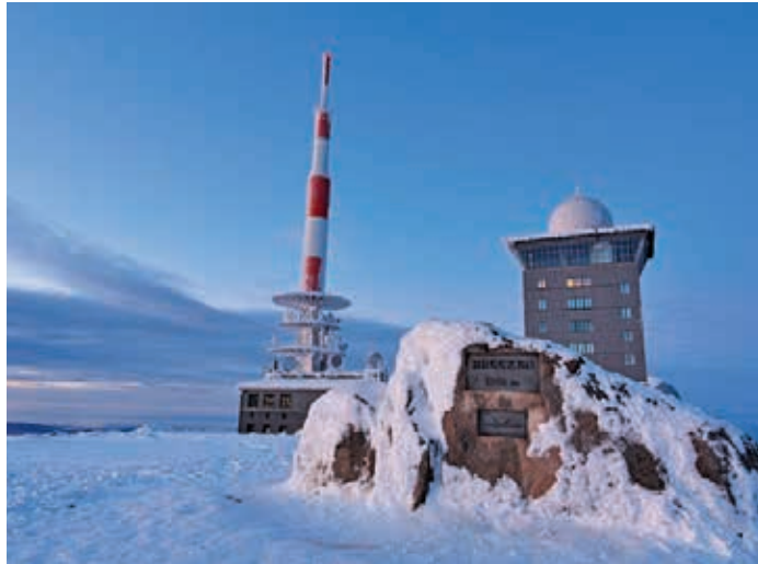
Kälte und Niederschläge prägen ganzjährig das Klima auf Norddeutschlands höchstem Berg, dem Brocken.