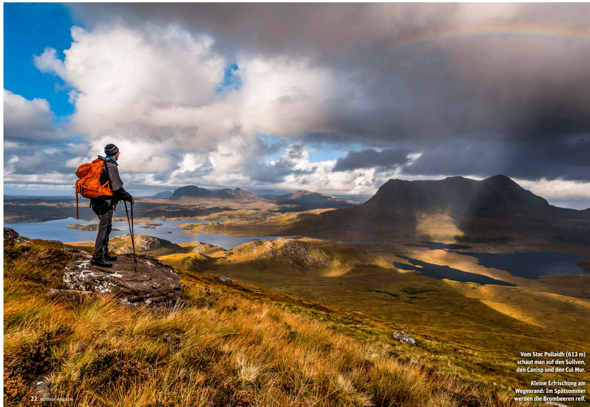
Vom Stac Pollaidh (613 m) schaut man auf den Suilven, den Canisp und den Cul Mor.

Nach einer Stunde anstrengenden Aufstiegs zeigt sich das Terrain flacher. Wir erreichen den Pass zwischen Ost- und Westgipfel des Suilven. Und – können nicht weiter! Sobald wir unsere Nasen über die Kante heben, zeigt uns die Natur, wer Herr im Haus ist. Nichts geht mehr. Natürlich probieren wir es trotzdem, werden aber schlichtweg umgeweht, landen in der nächsten Pfütze, kriechen auf allen vieren, um nicht über die Kante und damit den Berg runter gefegt zu werden. Scheitern auf 700 Metern. Man muss nicht ins Hochgebirge reisen, um zu erfahren, dass Wind menschlichem Tun und Träumen ein Ende bereiten kann. Aber ist es nicht auch diese ungezähmte Urkraft, die wir draußen in der Natur suchen? Und immerhin – keine Midges ... ◀