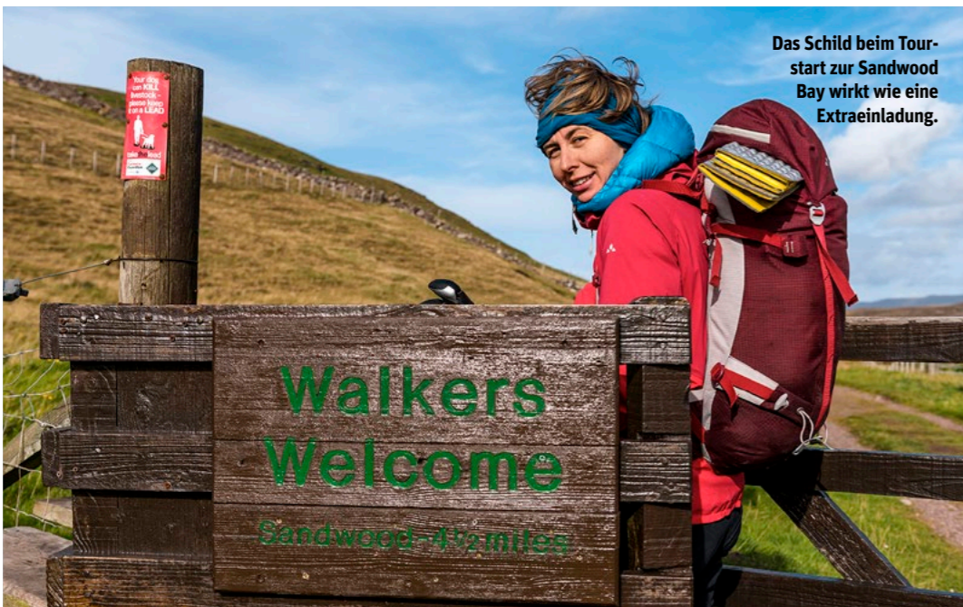
Das Schild beim Tourstart zur Sandwood Bay wirkt wie eine Extraeinladung.