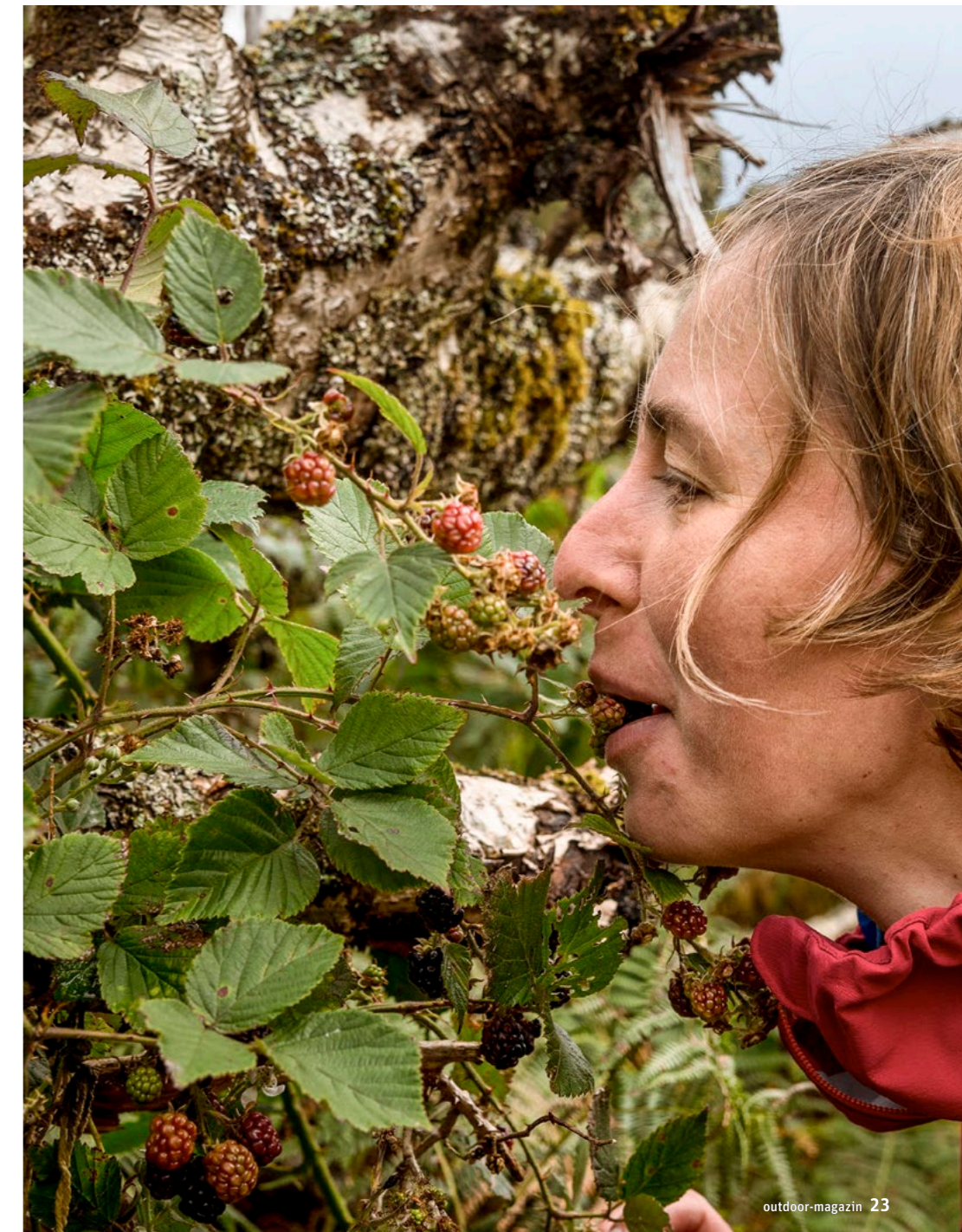
Kleine Erfrischung am Wegesrand: Im Spätsommer werden die Brombeeren reif.